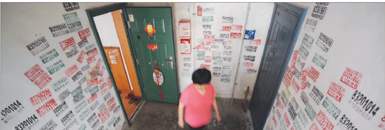
你看这些“牛皮癣”烦人不烦人

昨天,升到六(3)班的王乐媛和其他同学一起,走上小小听证会的讲台,面对工商、经济执法、检察院等单位派来的“听证员”侃侃而谈。