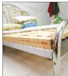
张家地上几乎没家具,连床都是不锈钢的

“道路拓宽本是一件好事。但是,如果办得不扎实,也会变成坏事。”老百姓真诚期望,相关部门以后再办类似便民工程,一定要把好事办实,实事办好。