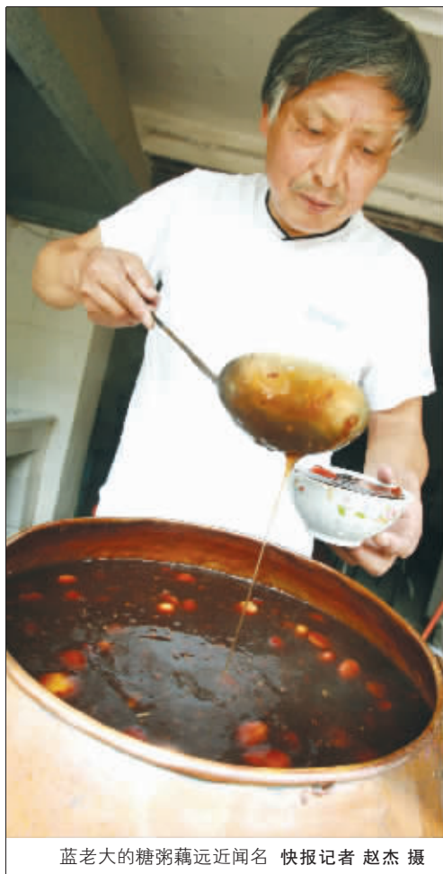
蓝老大的糖粥藕远近闻名

老南京人喜欢在中秋节喝碗糖粥藕,图个吉利。谚语云:小孩吃藕,开窍早;大人吃藕,路路通;夫妻吃藕,成双对;新媳妇吃枣、吃莲,早生子;粥中有桂花,寓意命中富贵;藕断丝不断,与远离故土的亲人血脉相连。