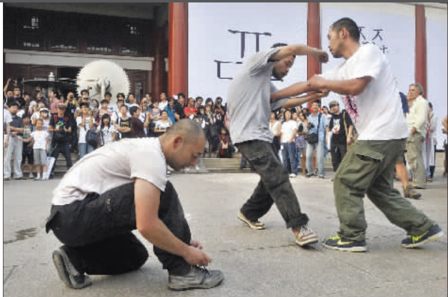
三个男人扭作一团,表演行为艺术