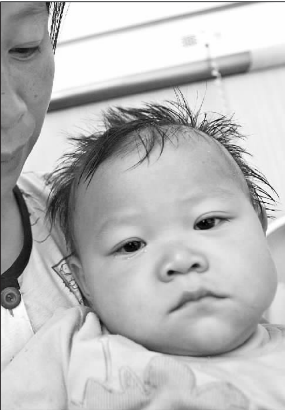
一名来自安徽的患儿正在南京市儿童医院接受治疗

记者12日从河北省石家庄市政府获悉,石家庄市政府调查组初步认定,石家庄三鹿集团股份有限公司所产的婴幼儿问题奶粉是在原奶收购过程中被不法分子添加了三聚氰胺所致。三鹿集团是否在生产环节也添加了三聚氰胺,卫生部新闻发言人毛群安表示,目前由卫生部牵头的联合调查组仍在调查之中。