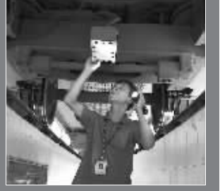
人们安心乘地铁的背后,与众多工作人员的付出密不可分

原来进地铁前,他就是浦镇车辆厂的一名技修工,列车的任何一个部件,他都了如指掌,“有些故障,肉眼就能看出,比如车底紧固件的检查,而有些则必须有仪器。”