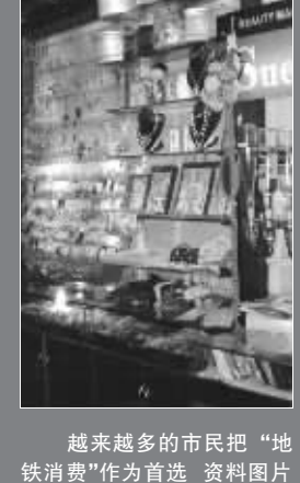
越来越多的市民把“地铁消费”作为首选