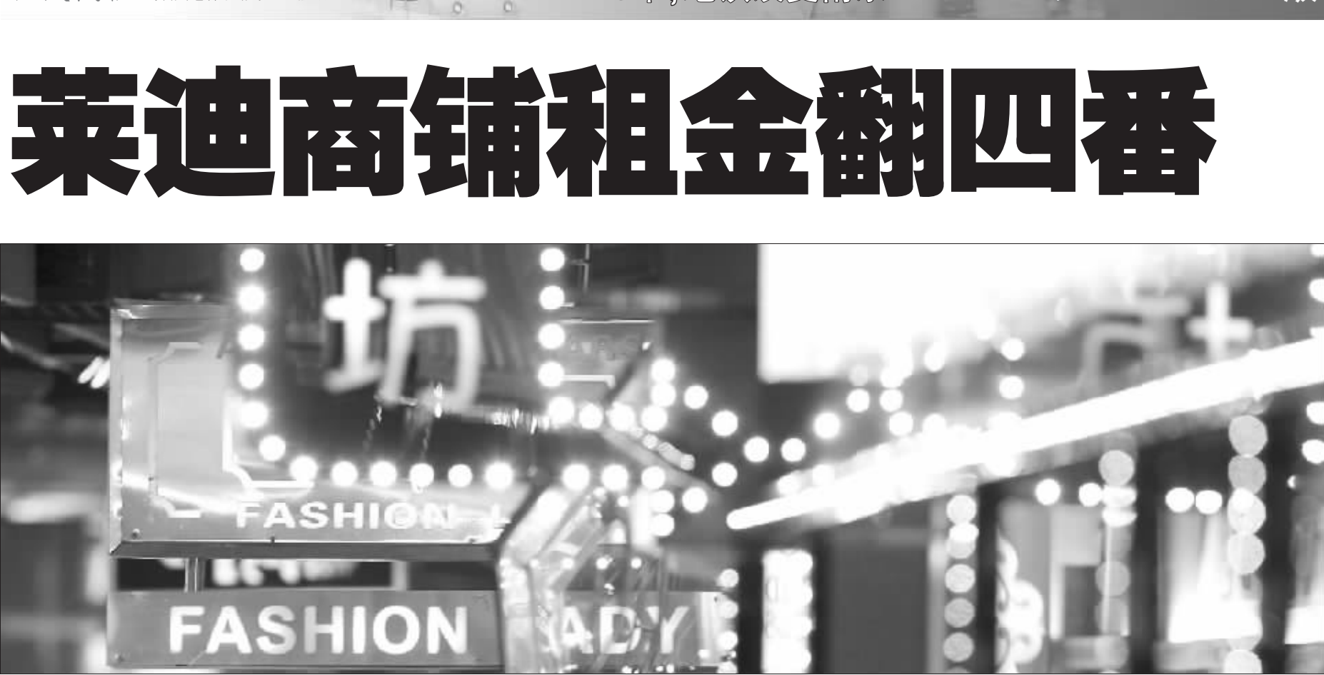
莱迪广场已是南京地铁文化的代表