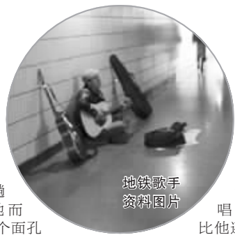
地铁歌手 资料图片

从南向北,从北向南,地铁一号线已通行三年。每天,一趟趟列车疾驰而过,一个个面孔行色匆匆……在忙碌中,你可曾为一小小的感动驻足留恋? 不记得哪个夜晚,通往地铁的通道里,回荡着这样的歌声,划过心头。行人放慢脚步,有了驻足的理由。