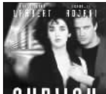
片名:《地铁》 导演:吕贝松 主演:克里斯托弗·兰伯特 让-伊格·昂格拉 伊莎贝尔·阿佳妮