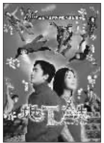
片名:《地下铁》 导演:马伟豪 主演:梁朝伟 杨千桦 张震 董洁 范植伟 桂纶美