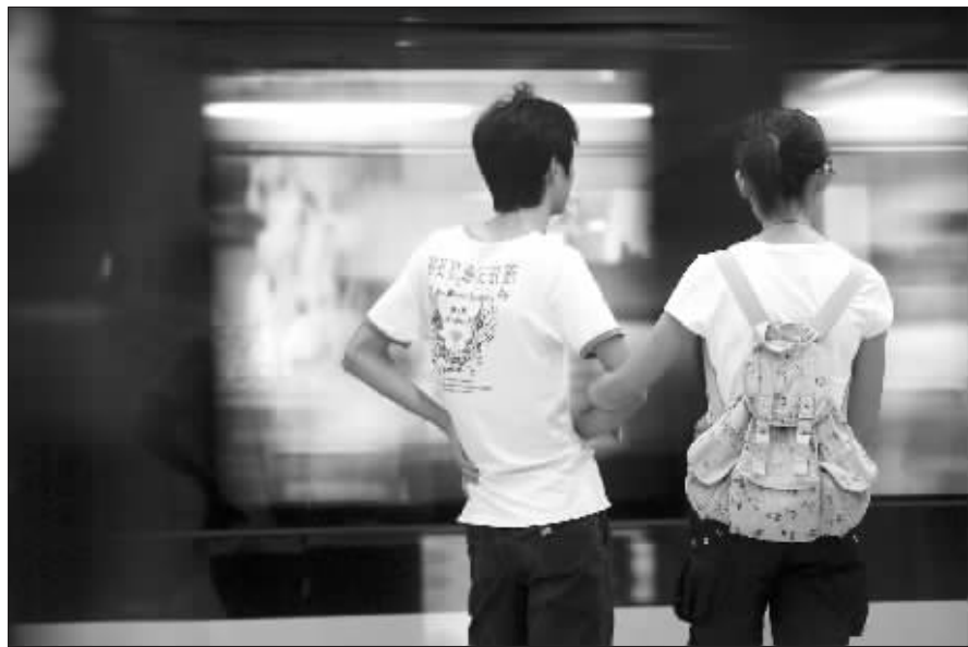
他们年轻的背影,勾起多少人美好的回忆

“朋友曾给我发了条心理测试的短信,问最浪漫的约会地点在哪,我毫不犹豫就选择了地铁。”“情系地下铁”到现在也不明白,事情怎么会这么巧,难道早就预示着他将在地铁里遇见爱情? 事隔三年多,他向记者描述时,对每一个细节依然记得清清楚楚。