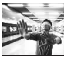
片名:《开往春天的地铁》 导演:张一白 主演:耿乐 徐静蕾 张杨 王宇 高圆圆