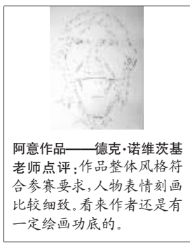
阿意作品——德克·诺维茨基 老师点评:作品整体风格符合参赛要求,人物表情刻画比较细致。看来作者还是有一定绘画功底的。