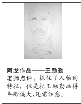
阿龙作品——王励勤 老师点评:抓住了人物的特征,但是把王励勤画得年龄偏大,还需注意。

本周,“奥运明星我来画”动漫绘画比赛决出了第三组周冠军,并且推出了第四组选手。随着赛程的进行,选手们的竞争也越来越激烈。本周一位中国美院的学生将带着他颇具想象力的作品,向周冠军发起挑战。