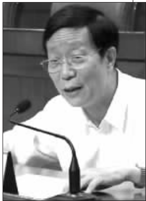
应松年:国家行政学院法学部主任、教授,中国法学会行政法学会会长

观点: 有权力的人就应该承担责任,权力就处于你所负的责任当中,这两者是对等的。如果出了事,损害了国家和百姓的利益,就要追究你的责任。