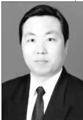
乔新生:中南财经政法大学社会发展研究中心主任、教授

观点: 有权力的人就应该承担责任,权力就处于你所负的责任当中,这两者是对等的。如果出了事,损害了国家和百姓的利益,就要追究你的责任。