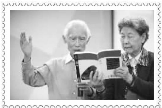
余光中在南京五中朗诵自己的诗