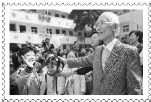
余光中和秣陵路小学的孩子们在一起