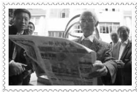
余光中在看快报上有关他的报道