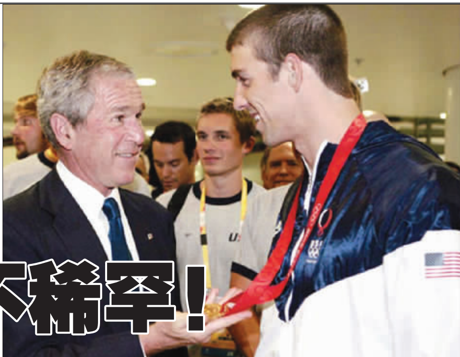
布什:我把女儿介绍给你, 怎么样? 菲尔普斯:不好意思, 我有女朋友了! (设计台词)