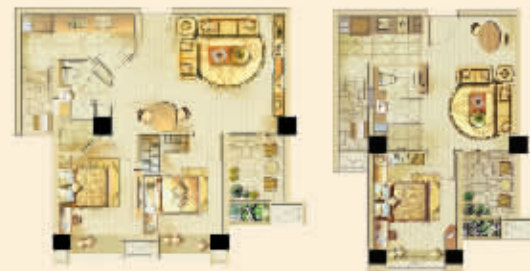
【两房两厅一卫 约73m 2 】