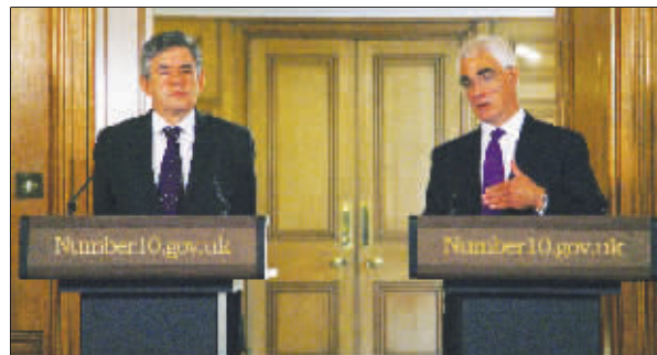
英国首相布朗(左)和财政大臣达林

冰岛政府接手陷入困境的第二大银行 Landsbanki 并停止取款业务,急坏英国数十万储户。英政府8日誓言,为维护本国民众利益,不惜把冰岛告上法庭。