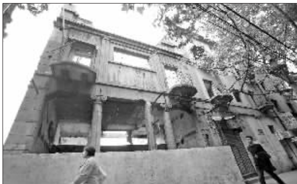
位于升州路上的民国建筑

记者看到,虽然这两幢建筑的身上都已被画上了“拆”字,但它们临街的一面墙体基本都被保留了下来。而靠西侧那幢房屋,则有一部分的内部结构已经被推倒,只剩下了临街的外墙。原先在这两幢建筑一楼开店的几家商铺,现在基本上只能见到之前的招牌了,目前只有一家小吃店和一家勉强容身的金铺还开张营业。