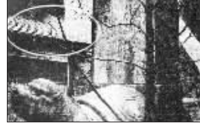
老照片中的房屋屋顶