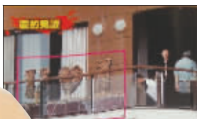
新居阳台惊现谢霆锋送的示爱礼物