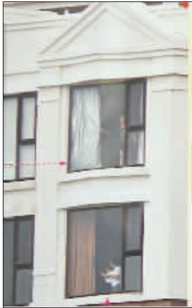
张柏芝监工,儿子和非佣玩耍