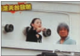
张柏芝日前去新居监工