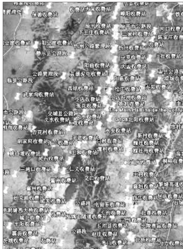
对于这张好像鱼网似的严严实实的网状图,网友态度不一

据调查,当地政府曾在 6 月份的时候,加大了对收费站点的清理力度,要求“凡不符合间距设置要求的、收费期限已满、私自设立的收费站,坚决予以撤除”。而网友的“控诉大会”,似乎反证这场清理行动的成效并不令当地出行人满意。 据《信息时报》