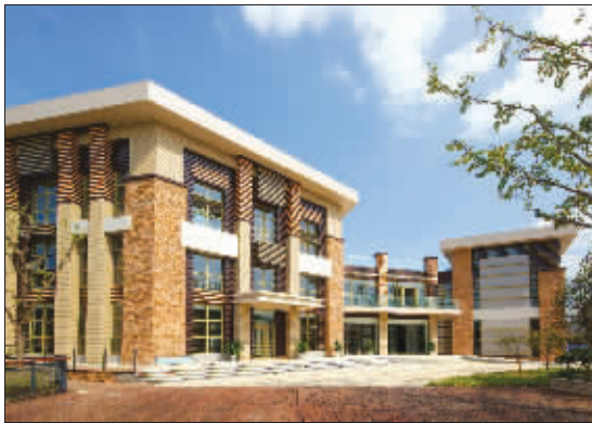
投入更多时间来打磨产品的自然天成

“与普通公寓产品不同,高端产品要经历一个厚积薄发的过程。”采访中,自然天城、山河水等项目相关负责人均表示,在没有把产品做到极致之前,基本上不会大规模放量。而且从资金链方面考虑,自然天城、山河水、绿城玫瑰园等项目,开发企业实力雄厚,完全可以投入更多时间来打磨产品。“预料中的热闹场景没有出现,估计江北别墅的竞争是要推迟了。”据业内人士预估,到年底前江北别墅会有小规模放量,而真正的别墅大战恐怕要等到明年。