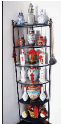
这些收藏的酒瓶已失去主人