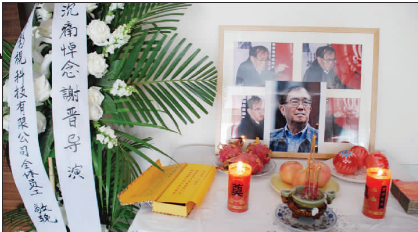
谢老的书房已被布置成灵堂