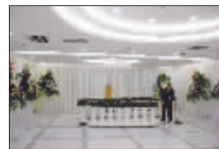
龙华殡仪馆的灵堂正在布置