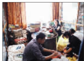
谢老的学生在其书房折纸钱