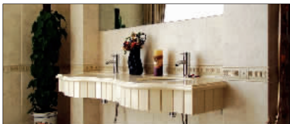
参加名优精品展的马可波罗瓷砖

昨天,记者从展会组委会获悉,目前已有近百位读者报名。从下周一开始,快报读者可以带有效身份证件到新街口建华大厦来领取门票,凭票不但可以免费参加抽奖,还能得到一本价值20元的高档笔记本。