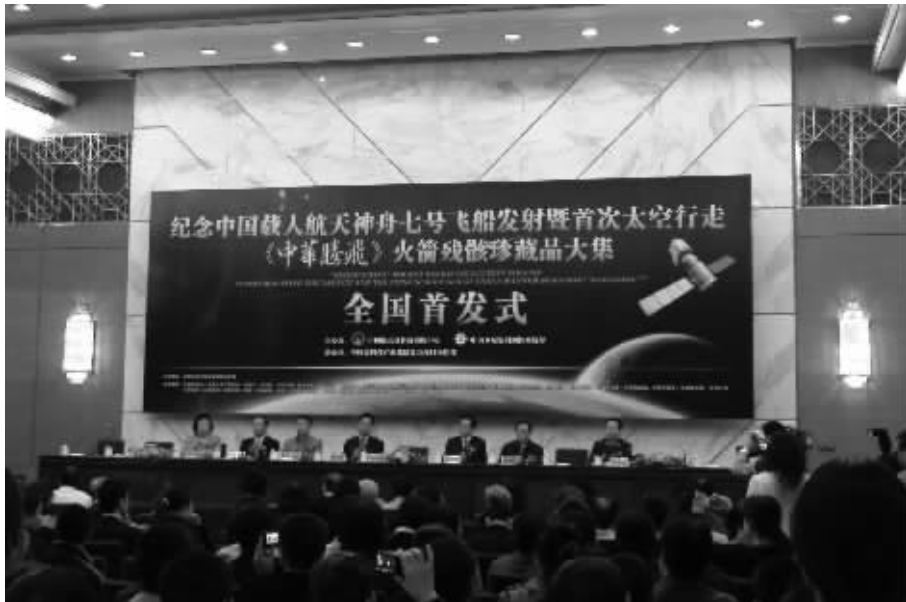
▲2008年10月7日上午10时，《中华腾飞》火箭残骸太空邮票首发式在北京人民大会堂隆重举行

“《中华腾飞》太空藏品大全套”由军方批准、官方发行，全套包括：①用神舟火箭残骸铸造的“航天邮票”24枚；②用神舟火箭残骸铸造的航天员“太空像章”6枚；③内嵌神舟火箭残骸原件的“太空神七模型”一尊。这是人类收藏史上开天辟地的第一套用太空返回残骸铸造的“太空藏品大全套”，纪念了包括“神一至神七”在内的中国航天事业创建52年来的整个历程，是真正的“航天大全套”，迅速掀起抢购收藏的热潮！首批少量货源已经到我市，数量有限，欲购从速！如遇断货，将以预订的先后顺序领取。