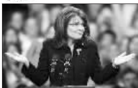
主演:萨拉·佩林(共和党总统候选人) 副总统候选人 剧情一:滥用金钱。共和

党耗费15万美元给萨拉·佩林一家购置装饰的风波尚未淡出公众视线,美国媒体24日又曝出,共和党竞选阵营10月上半月工资最高者居然是佩林的化妆师埃米·斯特罗齐,其收入为2.28万美元。