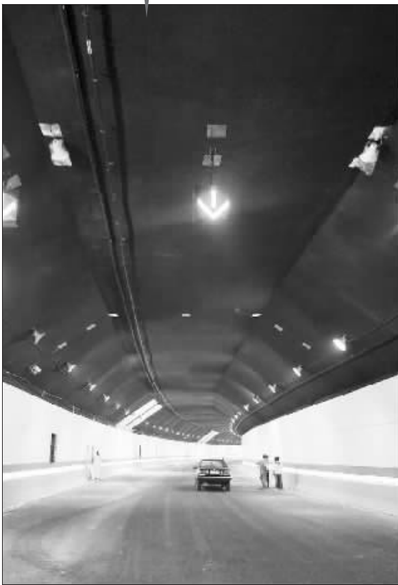
即将通车的模范马路隧道