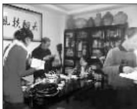
媒体群起到贾府求证