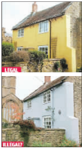
别墅外墙粉刷前(上)后