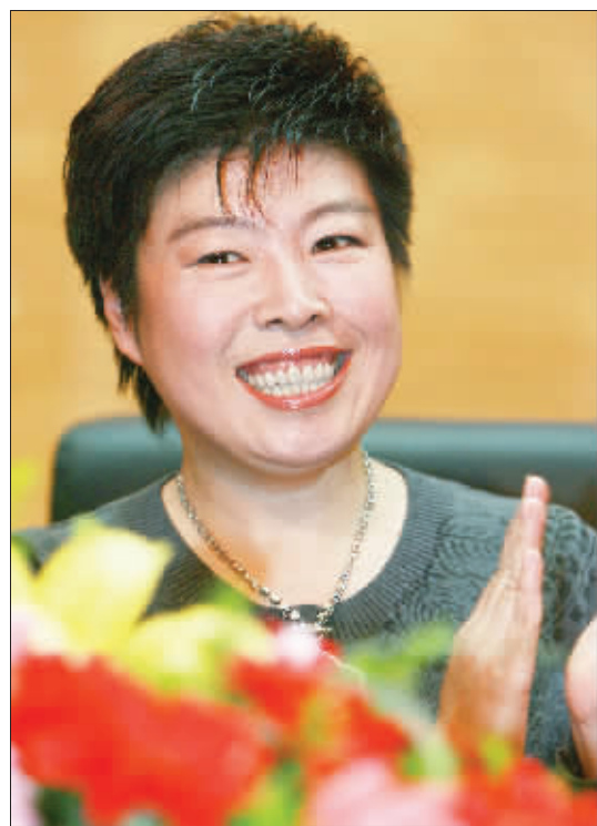
台上的于丹,一脸轻松

这玄而又玄的讲演,也许一般人听不下去,但现场的粉丝却是听得投入。很多人都是一手拿于丹的新书一手拿着笔记,听到有用之处就立刻记下,有些粉丝甚至全场都没有停笔。还有不少粉丝干脆用录音笔或者DV录下全程讲座,要带回家好好品味。记者发现,来听讲座的读者年龄跨度也不小:最老的白发苍苍,白胡子已经蓄到胸口,小的看上去也不过刚上初中,牵着妈妈的手,听得很投入。