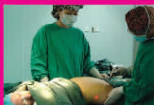
激光溶脂手术进行中