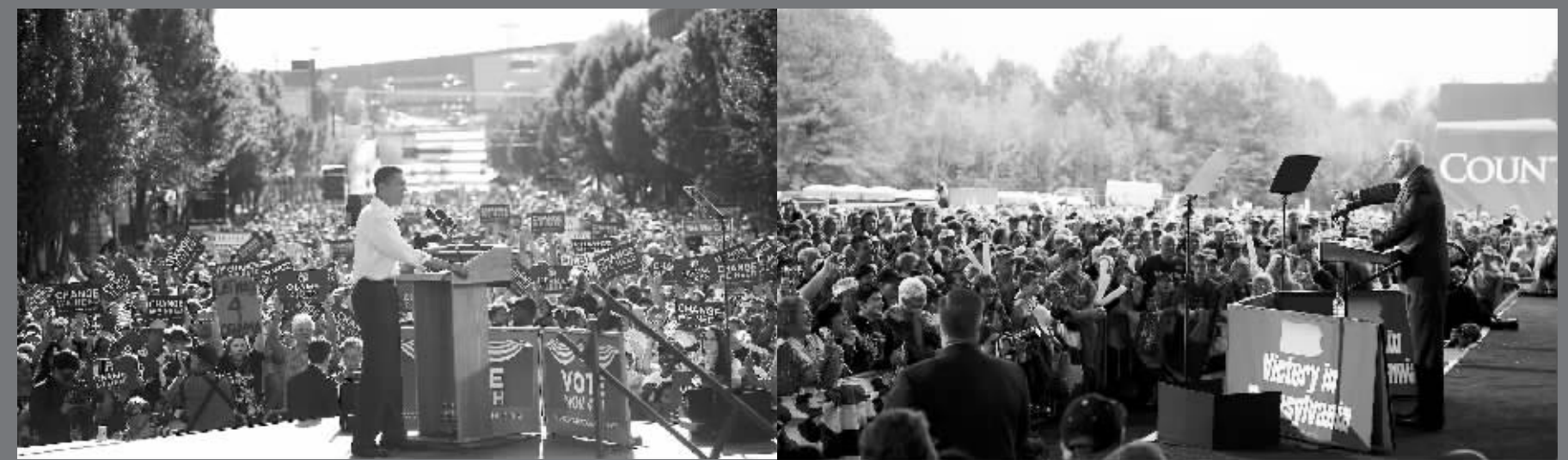
大选进入最后冲刺阶段,奥巴马在科罗拉多州(左)、麦凯恩在宾夕法尼亚州(右)展开最后的拉票活动。