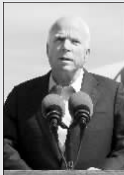
麦凯恩:我们会扳回来

夫妇俩渴望为本月4日总统选举投下庄严一票,遂请求选民登记地点、纽约曼哈顿区选举办公室把选票寄往印度。然而,申请迟迟未得到回音。于是两人商量后决定,飞回纽约亲自投票。报道说,为飞回美国投票,这对夫妇要从印度乘飞机22个小时、跨越1.5万公里,花费5000美元。