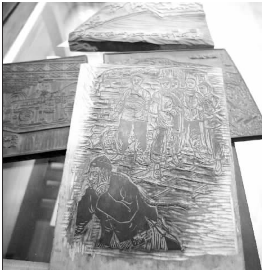
十竹斋仅存的一些木版