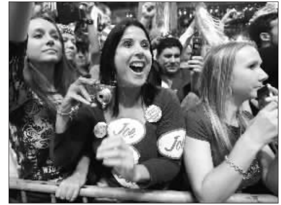
11月3日，共和党总统候选人麦凯恩抓紧利用这最后的机会为自己竞选拉票。图为麦凯恩的支持者。

布利斯为帮奥巴马拉票者设立“电话银行”，在家中遍布电话。她说：“许多人以往从未做过这种(打电话拉票的)事，多少有些紧张。”