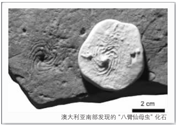
澳大利亚南部发现的“八臂仙母虫”化石