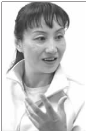
于芬已成为体育界“维权斗士”