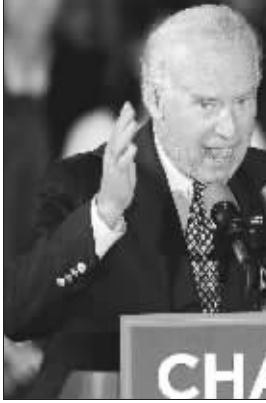
拜登在外交方面的专长得到广泛认可和尊敬