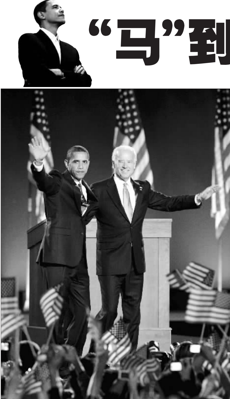
奥巴马(左)和拜登在芝加哥宣布大获全胜

美国总统选举4日落幕。贝拉克·奥巴马以巨大优势击败共和党对手约翰·麦凯恩，历史性地当选美国首名非洲裔总统。 他定于2009年1月20日就任第56届总统。 压倒性胜利 统计结果显示，截至美国东部时间5日7时(北京时间20时)，奥巴马赢得338张选举人票，远超当选所需270张。麦凯恩仅获163张。 奥巴马赢得6200多万张选民选票，总数过半，麦凯恩5500多万。 与选前多数民意调查相符，开票后不久悬念尽失。至美国东部时间4日晚上11时(北京时间5日12时)，奥巴马已稳获胜佛罗里达州、弗吉尼亚州、俄亥俄州和宾夕法尼亚州。 这4州皆为“战场州”，选举形势早早早明朗。麦凯恩大势已去，11时(北京时间5日12时)刚过打电话给奥巴马，承认失败。 11时30分(北京时间5日12时30分)前后，他发表讲话认输。 11时12分左右，总统乔治·W·布什祝贺奥巴马当选，承诺积极配合权力交接，“你将开始人生中伟大的一段经历，尽量享受吧”。 历史性成就 奥巴马随后在芝加哥向10多万名支持者发表讲话，承诺与共和党合作，为美国带来变革。 奥巴马支持者在各地庆祝、狂欢。 电视画面显示，在芝加哥、华盛顿、纽约等城市中心区，电视墙上滚动播放着奥巴马获胜的画面。 众多选民挥舞着标语牌，高呼“奥巴马！奥巴马！”不少非洲裔选民流下激动的泪水。 佐治亚州联邦众议员、民权运动领导人约翰·刘易斯形容，奥巴马当选，如同美国政治一场“非暴力革命”，表明非洲裔人口政治权利得到显著提升。 全面性优势 除了总统和副总统外，选民还选出35名参议员，全部435名众议员和11个州的州长。 参议院和众议院方面，民主党扩大优势。 现阶段，民主党占据参议院51席，共和党49席。美联社推测，民主党将扩大领先优势，但难以取得60席。 如果民主党获得60个席位，将消除共和党否决议案的可能性。 众议院方面，民主党现阶段以236领先于共和党的199席位。民主党可能再增加20个席位。 一些分析师认为，4日选举结果意味着，民主党将控制白宫和国会两院，显示共和党全面麻烦。 4日开票过程中，美国各大媒体选举地图上，代表民主党的“蓝色”不断“吞噬”原属共和党票仓的“红色州”。 一些分析师说，金融危机和奥巴马超强人格魅力固然帮助民主党大胜，但共和党必须直面现实，从自身找原因。 布什前助理皮特·魏纳承认共和党“麻烦不小”，但认为自身理念并没有落后于时代。 克林顿不这么认为。他在纽约说，选民不单单在两名候选人之间做出选择，更看重两党执政理念。 韩建军(新华社供本报特稿)