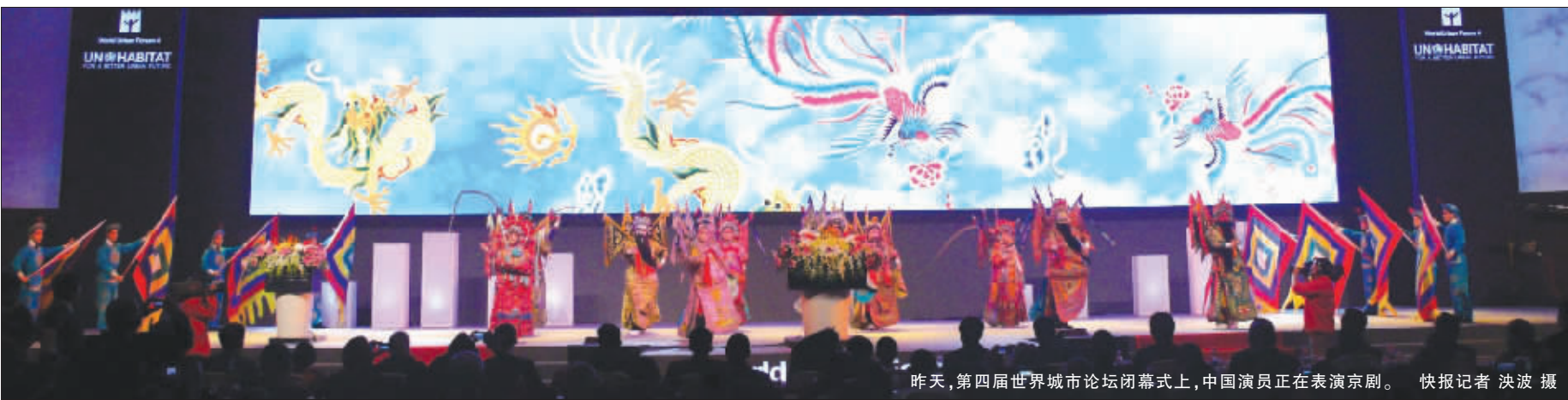
昨天,第四届世界城市论坛闭幕式上,中国演员正在表演京剧。