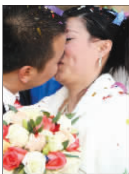
婚礼现场,两人激情接吻