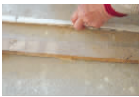
电线保护套被工人踩破