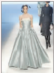
刘亦菲的仿制礼服与名牌礼服很相似