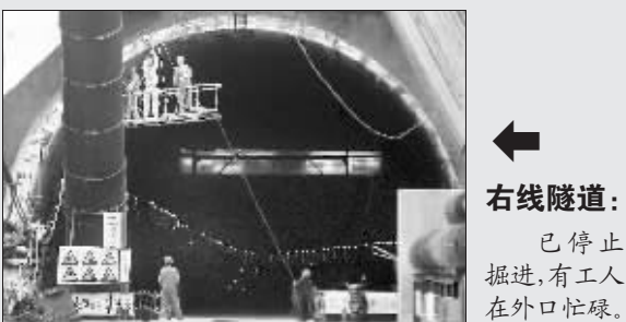
右线隧道: 已停止掘进,有工人在外口忙碌。