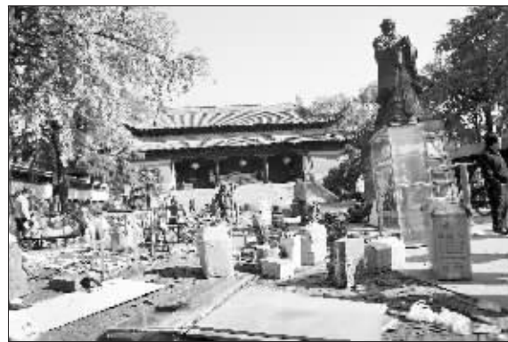
摊主们正在忙着搬家

快报讯(记者 胡玉梅)留恋不舍;打包、搬家……一夜之间,朝天宫的室外古玩市场成了“历史”。怀着矛盾和恋恋不舍的心情,朝天宫古玩市场的摊主们昨天彻底清理现场。