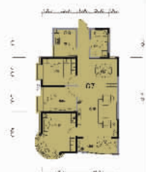
项目主推 G7 户型, 面积 114m 2 , 整个户型动线流畅, 而主卧室弧形景观窗的套型设计, 超大的主卧空间, 大阳台、全明设计。