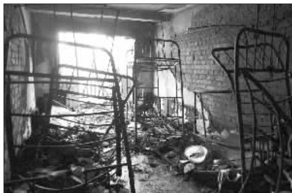
起火宿舍床都只剩下钢筋了