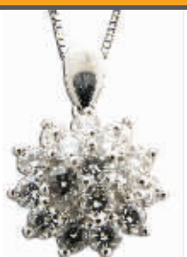
地质人推出的群镶吊坠

一年一度的中国国际珠宝展日前在北京开幕。然而,2008年的珠宝展较往年有所特殊,面对全球金融风暴引发的行业危机愈加明显,珠宝业也无法逃避大环境所带来的影响。此次参展商比上届减少了15%。在南京,各大珠宝企业也受到了一些影响,不过业者仍然对未来充满信心。记者采访得知,经历着11月的小淡季,珠宝企业们正摩拳擦掌,准备推出新款产品及各类回馈促销活动,重拳出击即将到来的12月旺季。