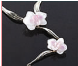
粉粉的爱琉璃饰品

这款吊坠多彩与分明层次体现得淋漓尽致。它也许不适合天真无邪的少女的颈间,更适合职业的,或者有些人生阅历的女人佩戴。