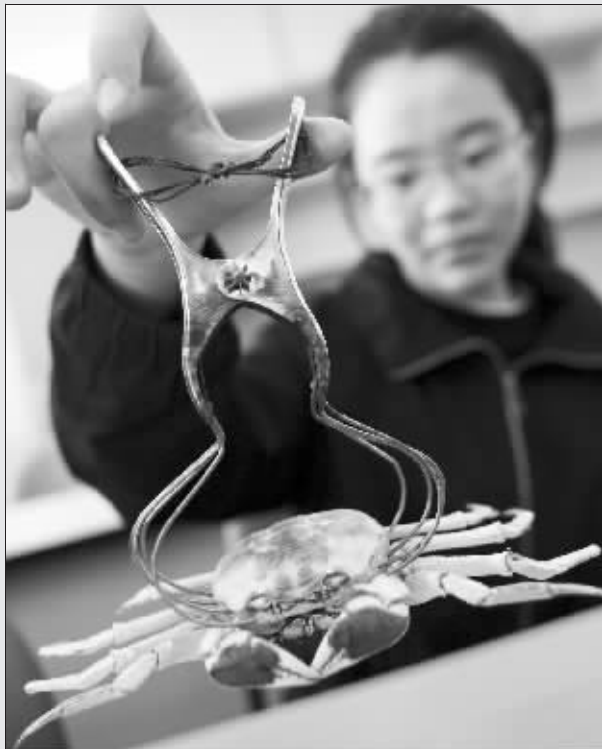
一诺发明的螃蟹夹能轻松抓螃蟹