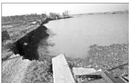
江滩塌陷,江水涌进

断裂江堤后面是一家养殖场,养殖户及其饲养的奶牛已安全转移,但上百亩鱼塘紧靠坍塌江堤,可能保不住了。