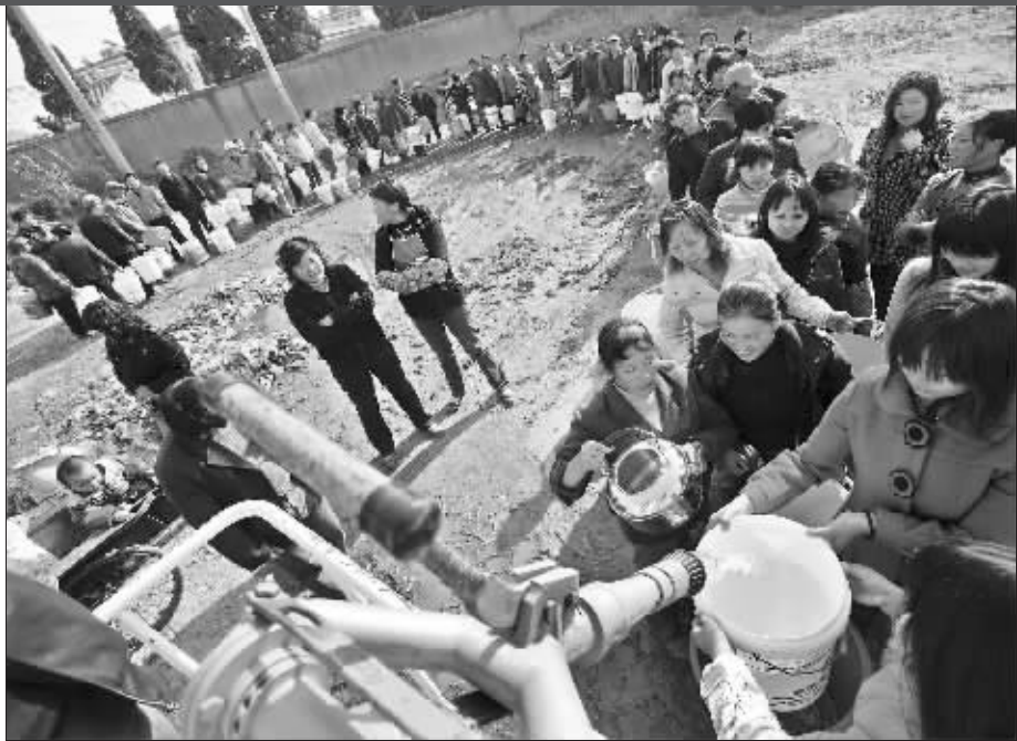
居民正在排队接水