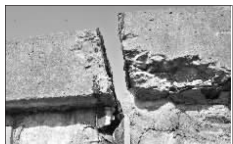
大堤上的裂缝