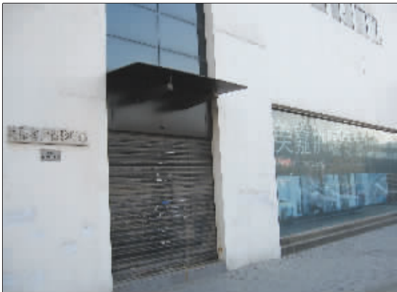
铁将军把门的美嘉供暖

近日,有十几名消费者联名向快报《居家》编辑部投诉,他们均与美嘉供暖系统服务公司签约,并全额交付了几万到十几万元不等的款项,但是这家公司却好像“人间蒸发”了,其位于江东中路1号的店面人去楼空。目前,这十几户人家,有的只在地面上开个槽,有的仅布下了管道,更有的连施工人员上门的影子都没见过。