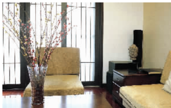
锦华装饰设计出品