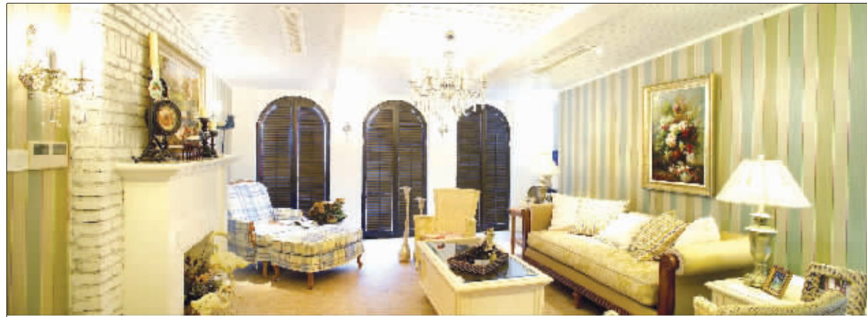
京派代表企业业之峰装饰设计出品

年关临近,各个家装企业举办的跨年度工程活动也多了起来。都是跨年度工程,究竟谁家的更值得信任呢?11月30日,由快报《居家》周刊举办的第二届京派高品质家装品鉴会将在金陵饭店钟山厅举行。同样是以跨年度工程为主题,京派高品质品鉴会将为消费者提供更全面的服务和更多的质量保障,让消费者真正后顾无忧。