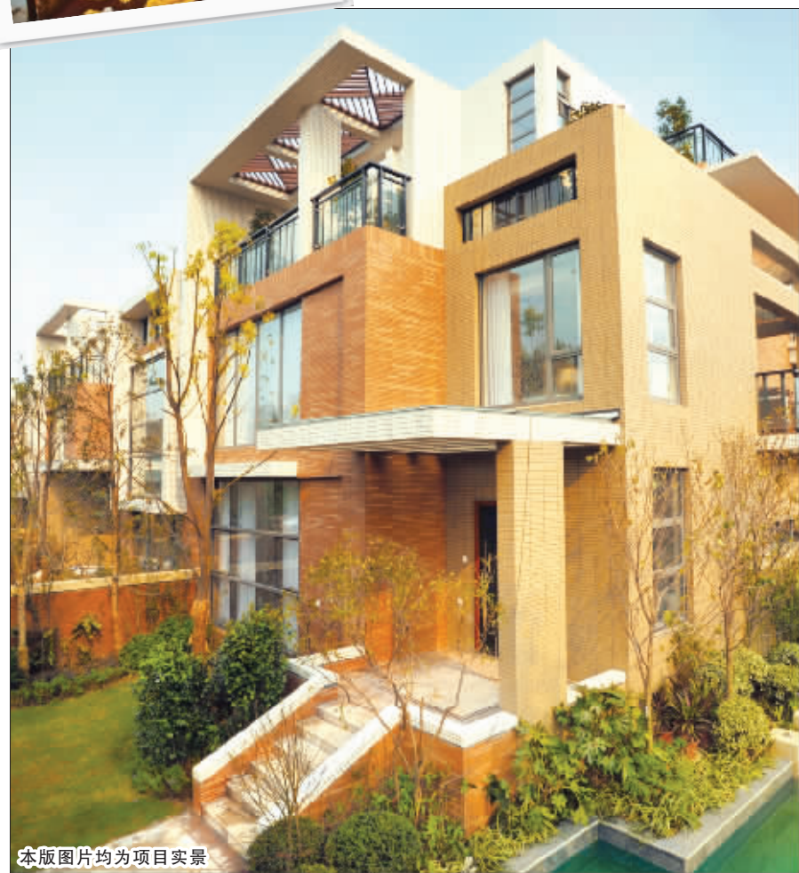
本版图片均为项目实景