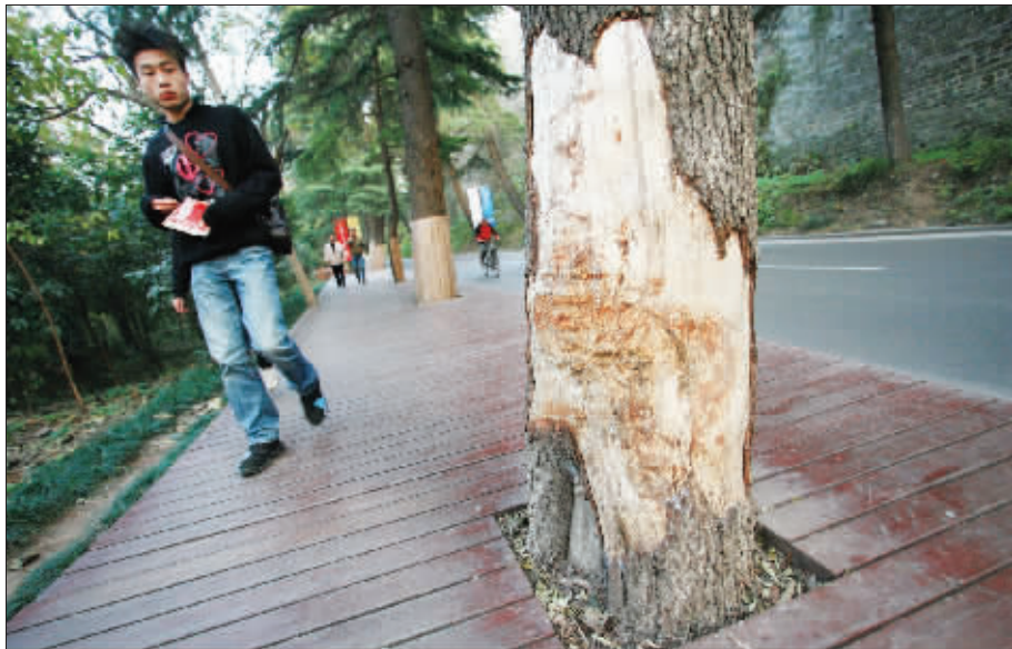
雪松已有70岁树龄

中 山陵景区龙脖子路上,高大葱郁的雪松是“主角”。即使在寒冷的冬季,这里也绿意盎然。然而,却有人将黑手伸向这些已经七十岁的元老级松树。昨天,记者在这里发现,一些大树的树皮竟被人剥去了一大块,露在外的内层树干上已是“泪流满面”。