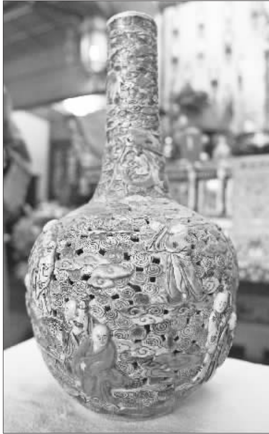
粉彩镂空十八罗汉花瓶