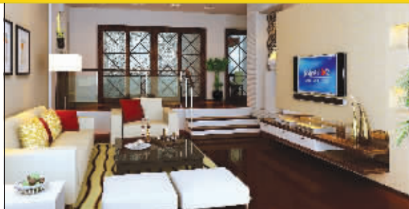
融入现代元素的简约欧式让整体居住空间显得更为时尚