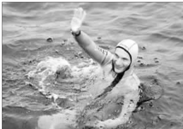
成功打破憋气纪录的吉诺尼

上周三,意大利潜水员吉安鲁卡·吉诺尼在意大利曼图亚省埃文斯维尔市的一个游泳池中,展开了一项惊人的水下憋气挑战,在意大利定时协会官员的见证下,吉诺尼先从一个呼吸面具中吸了大约30分钟的纯氧气,令体内的血液充满了氧,以便为下水做准备。他这样做不算违规作弊,因为吉尼斯世界纪录总部允许憋气挑战者先进行30分钟的“氧气增补”。接着,吉诺尼在众人睽睽下潜入游泳池,开始进行水下憋气挑战。他在水底下足足坚持了18分零3.69秒后,才在众人的鼓